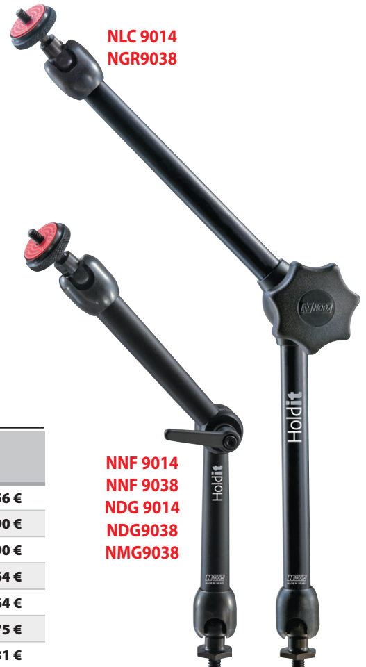
NLC 9014 NGR9038